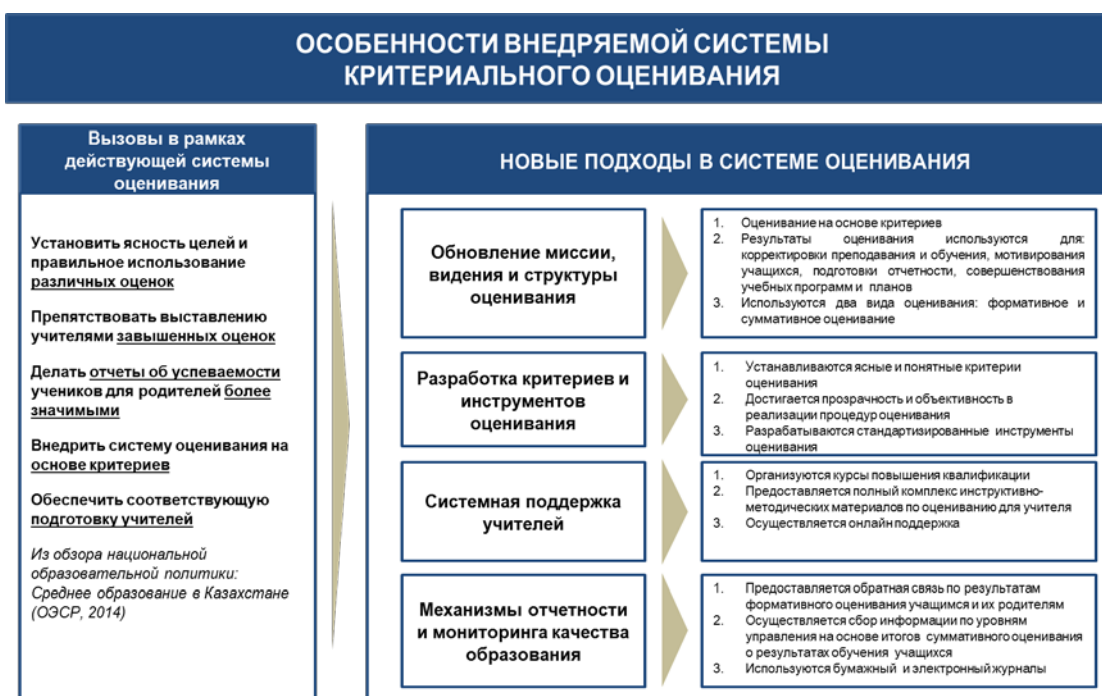
Рисунок 1 – Особенности системы критериального оценивания

Содержание системы критериального оценивания определяется стандартами, процессами, инструментами и результатами оценивания и регламентируется рядом нормативных и инструктивно-методических документов. В Правилах критериального оценивания определяется порядок организации и проведения оценивания учебных достижений обучающихся начальных классов организаций образования Республики Казахстан, в которых апробируются и внедряются учебные программы начального образования в соответствии с ГОСО РК-2015. В документе регламентируются: процедуры организации и проведения формативного и суммативного оценивания; процедуры проведения модерации суммативного оценивания за четверть; процедуры выставления оценок за четверть и учебный год; рекомендации по ведению портфолио обучающегося.